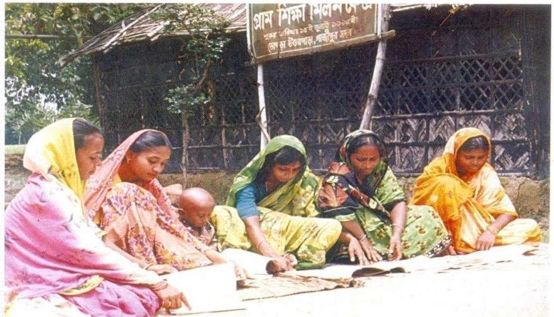
Literacy practice in front of a Gram Shiksha Milon Kendra (continuing education centre)