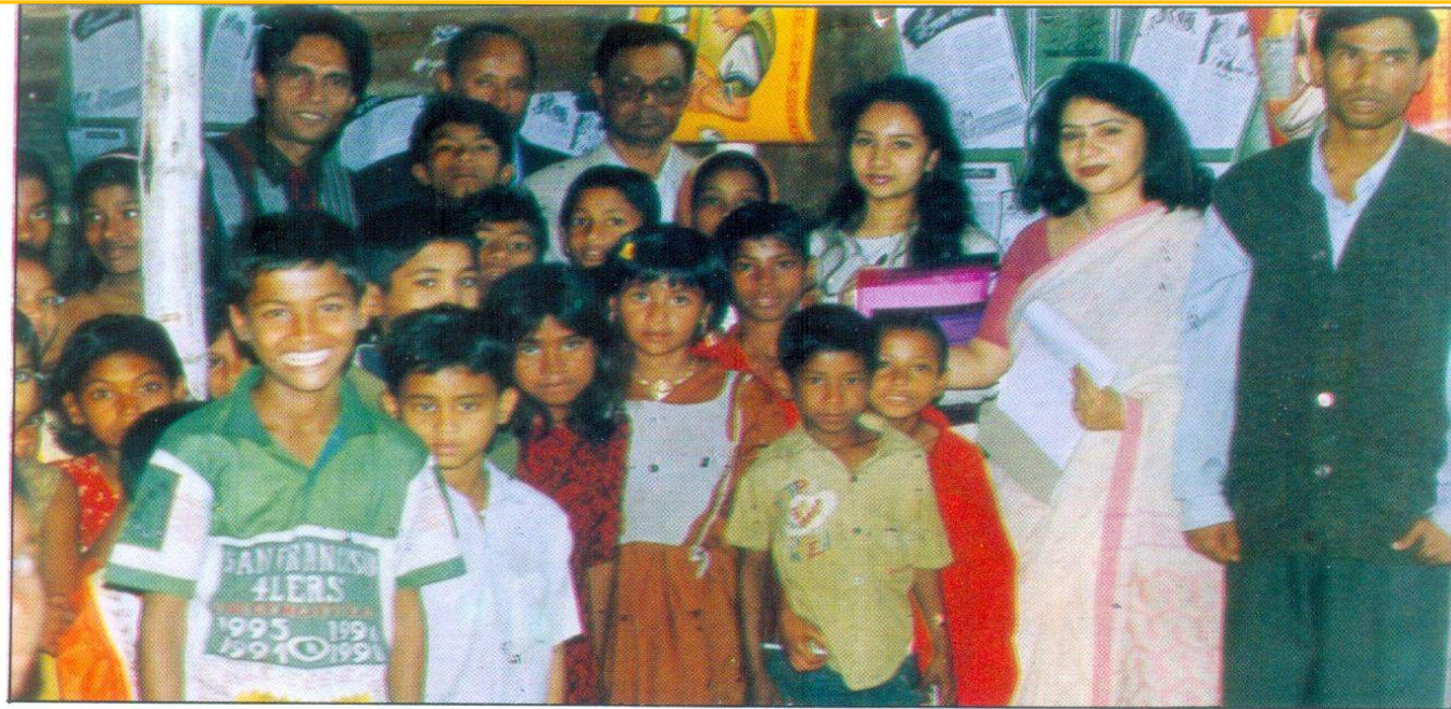
ইউনিসেফ আয়োজিত শ্রমজীবী শিশু-কিশোরদের শিক্ষা প্রকল্প 'হার্ড টু রীচ'-এর সাম্প্রতিক এক কর্মশালায় অংশগ্রহণকারীরা একটি শিক্ষা কেন্দ্র পরিদর্শন করেন।